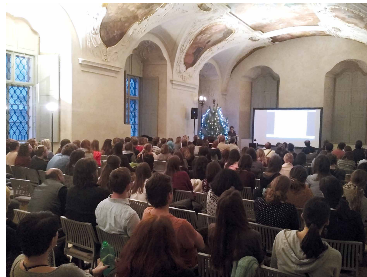
Z konference Restaurování a ochrana uměleckých děl 2017 v GASK v Kutné Hoře. [LM]