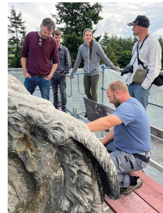
Z odborného setkání v Hořicích, 2025. [ZGL]

Smyslem konferencí bylo vytvoření platformy pro setkávání restaurátorů, technologů, historiků umění, památkářů, architektů a dalších profesí podílejících se