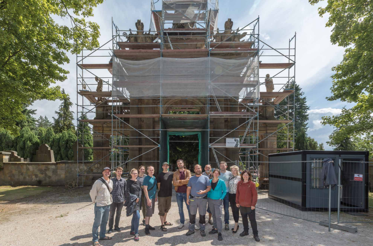
Odborné setkání členů a příznivců spolku Arte-fakt, hřbitovní brána na vrchu Gothard v Hořicích, 2025. [PG]

Arte-fakt, sdružení pro ochranu památek, vzniklo na jaře roku 2006 na základě podnětu několika mladých restaurátorů jako profesní organizace sdružující profesionály v oboru péče o památky. Založení sdružení vzešlo ze dvou základních impulsů. Prvním impulsem byla tehdy znovuobnovená debata o uznávání kvalifikace a statutu profese konzervátora a restaurátora v naší republice, která vyústila ve snahu o resuscitaci záměru založení Komory restaurátorů ČR, a druhým impulsem byla potřeba zakladatelů sdružení rozvinout aktivity, které přesahovaly mantinely jejich běžné restaurátorské praxe, zejména aktivit souvisejících se zvýšením informovanosti v oboru restaurování.