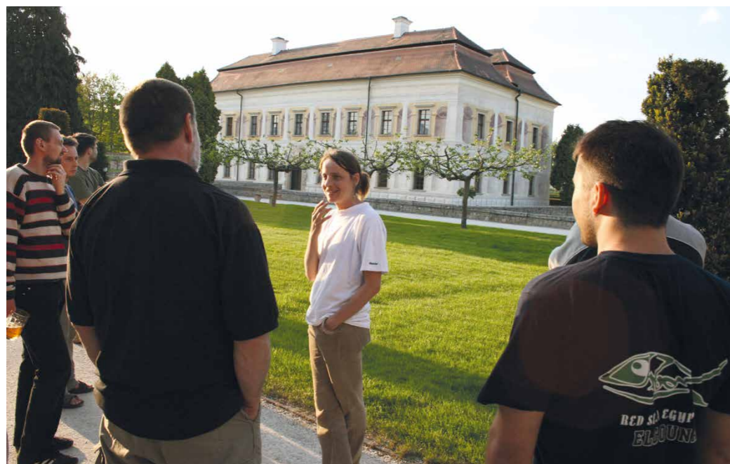
Z odborného setkání v interiérech zámku Kratochvíle 2008. [LM]

Druhou významnou aktivitou je pořádání výstav. Dosud největší takovou realizací byla výstava Arte-fakt 2010, restaurátorské práce v regionu Kutná Hora, která se konala v chrámu Nanebevzetí Panny Marie v Kutné Hoře – Sedlci. Na výstavě byly veřejnosti představeny vybrané restaurátorské práce z regionu, na kterých se podíleli členové sdružení. K vidění byly ukázky restaurování kamenných plastik, nástěnných maleb, závěsných obrazů a uměleckých děl na papíru. Jedním z nepopíratelných kladů expozice bylo, že vzhledem ke skutečnosti, že