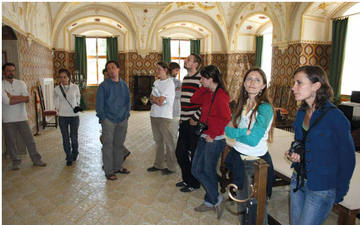
Z odborného setkání v interiérech zámku Kratochvíle 2008. [LM]

na obnově kulturního dědictví, výměna aktuálních informací z oboru a navázání a podpora mezioborové spolupráce. Konference mají obvykle jeden zastřešující leitmotiv, jedno aktuální téma, které je reflektováno v příspěvcích a prezentacích účastníků. Důležitým prvkem těchto setkání je prostor pro diskusi, ze které v některých případech vzniká i společné memorandum, na kterém se účastníci shodnou a které sumarizuje neaktuálnější situaci v oboru.