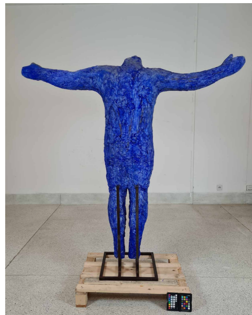
Obr. 3 Eva Kmentová, Opuštěný prostor , P8522, NGP, stav objektu po restaurování, celek. [DS]