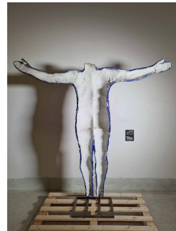
Obr. 1, 2 Eva Kmentová, Opuštěný prostor , P8522, NGP, stav objektu před restaurováním, celek. [DS]