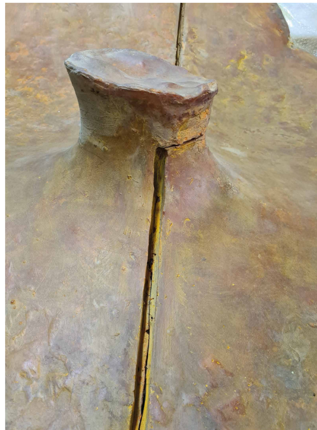
Obr. 6 Eva Kmentová, Pupek světa, P7099, NGP, stav objektu před restaurováním, detail. [DS]

Zároveň, kvůli stavu díla, bylo navrženo dílo vystavit v ležícím stavu, a ne zatěžovat původní konstrukci ani namáhat materiál vertikálním zavěšením. V rámci konceptu výstavy a záměru díla toto bylo možné.