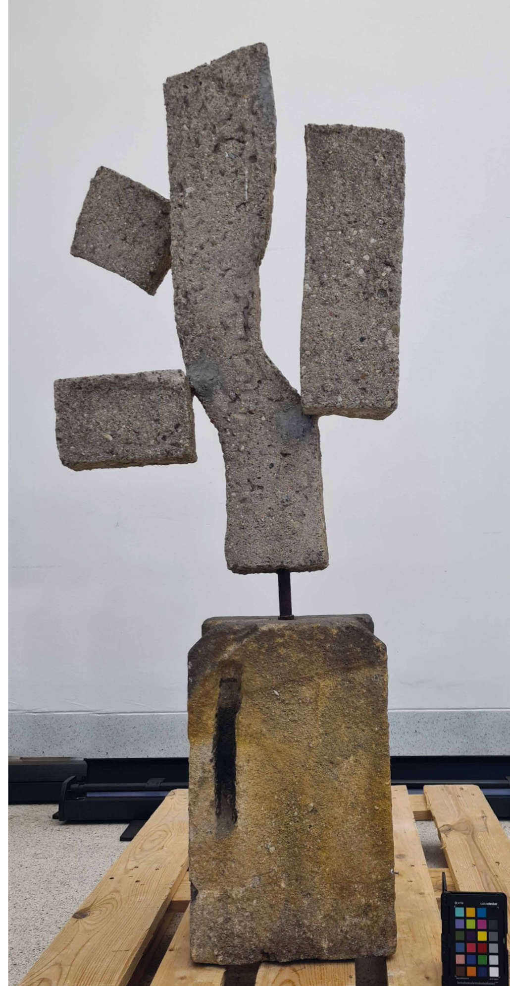
Obr. 9 Eva Kmentová, Strom I , P8465, NGP, stav objektu před restaurováním, celek. [DS]