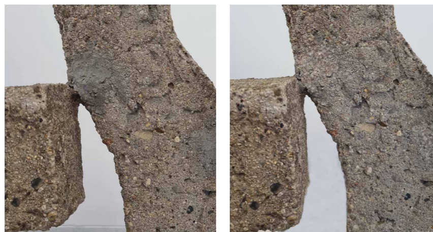
Obr. 7, 8 Eva Kmentová, Strom I , P8465, NGP, stav objektu před a po restaurování, detail. [DS]

Dílo již v minulosti bylo restaurováno, stopy použití Paraloidu na konsolidaci byly zřetelné, a proto bylo rozhodnuto zmírnit stopy starého zásahu – místo odstranění starých ztmavělých, ale stabilních tmelů pouze upravit povrch retuší (opět byly zvoleny akvarelové barvy Schmincke). Pískovcová spodní část nesla stopy staršího biologického napadení (jedná se o sochu, která byla vystavena v exteriéru) a byla ošetřena jenom povrchově. Pro transport pak bylo navrženo sochu permanentně upevnit na teflonový pás nebo na dřevěný podstavec kvůli možné degradaci pískovce při manipulaci.